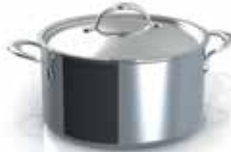
Covered Stockpot 8qt / 7.6L / 26cm