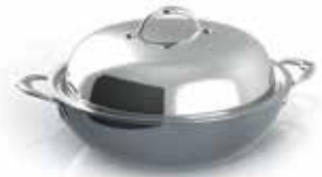
Covered Wok 14in / 36cm